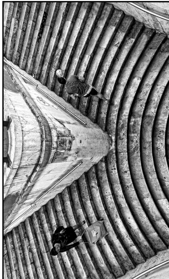
Contrastes - 1º Premio - 2013

XII CONCURSO de FOTOGRAFÍA 2014 de la COMISIÓN de IGUALDAD y MUJER del AYUNTAMIENTO de ESTELLA-LIZARRA