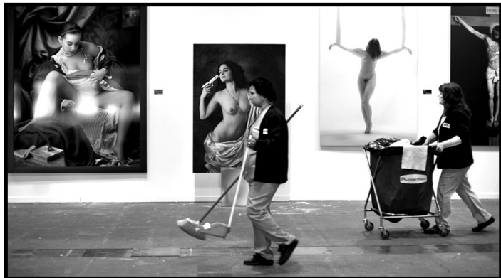
"Mujeres" 2º Premio - 2013