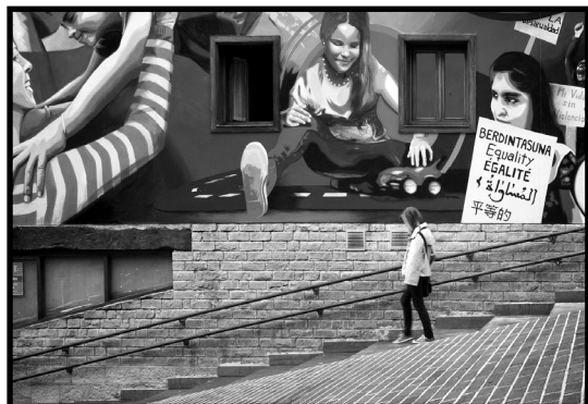
"Bidean" Accesit 2013