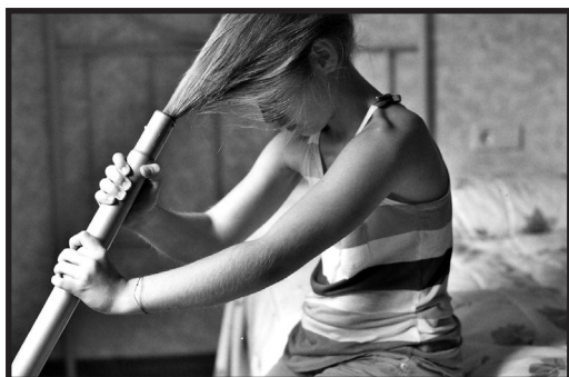
"Riesgo de la dedicación exclusiva: Absorción" 3º Premio - 2011