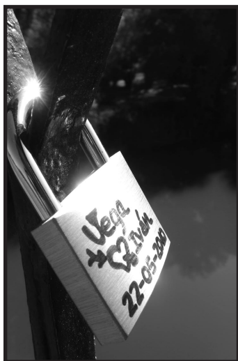
Mención especial - 2011: "Quien bien te quiere, te quiere libre".