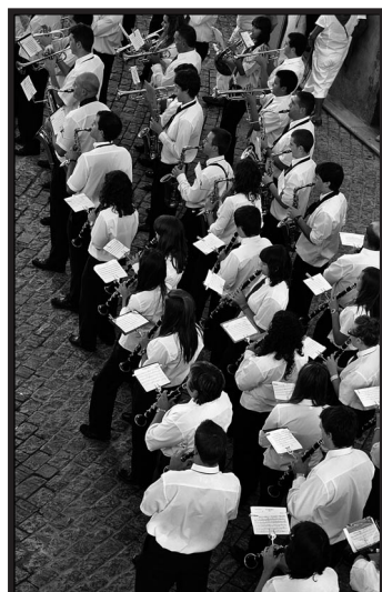
Mención especial - 2011: "Igualdad en la banda".