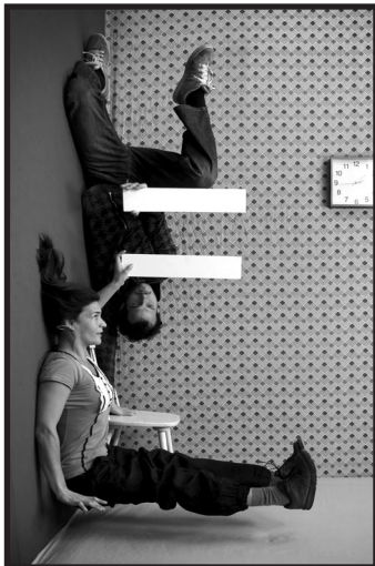
"Se mire como se mire, es igual" 2º Premio - 2011

LIZARRAKO UDALEKO EMAKUME ETA BERDINTASUN BATZORDEAREN X. ARGAZKI LEHIAKETA